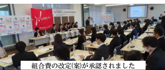
組合費の改定(案)が承認されました