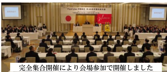
完全集合開催により会場参加で開催しました