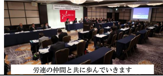
労連の仲間と共に歩んでいきます