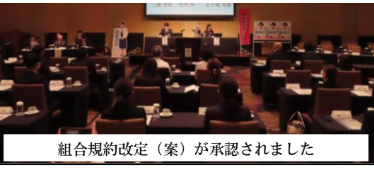
組合規約改定（案）が承認されました