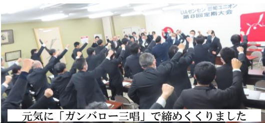
元気に「ガンバロー三唱」で締めくくりました