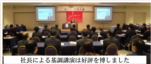
社長による基調講演は好評を博しました