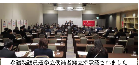
参議院議員選挙立候補者擁立が承認されました