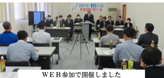
WEB参加で開催しました