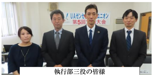
執行部三役の皆様