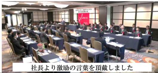
社長より激励の言葉を頂戴しました