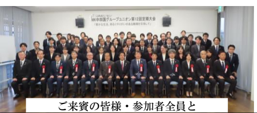
ご来賓の皆様・参加者全員と

大会報告・議案 2023年度報告／①一般活動報告 ②会計報告並びに会計監査報告 2024年度議案／第1号議案：組合規約改定 第2号議案：役員を選出 第3号議案：活動計画 第4号議案：予算 第5号議案：第27回参議院議員選挙候補者擁立