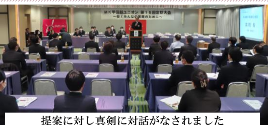
提案に対し真剣に対話がなされました